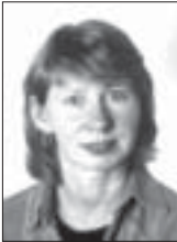
9. Förderpreis Brigitte Buchholz (gefördert mit 250,- DM)