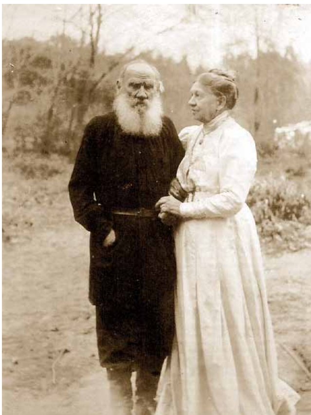
Das Ehepaar Tolstoj, 1895, auf ihrem Landgut Sasnaja Poljana

„Danach kommt es einem vor, als wären in den Wochen der Lektüre viele Jahre verstrichen, als hätte man an Welterfahrung gewonnen, ohne dass man dafür Katastrophen und Kriege erleben musste: es reichte, davon zu lesen. Ein Effekt, jenseits der Kunst und größer als Sie. Ich kenne keinen anderen Roman, der das vermag“, schreibt der Autor Daniel Kehlmann über „Krieg und Frieden“.